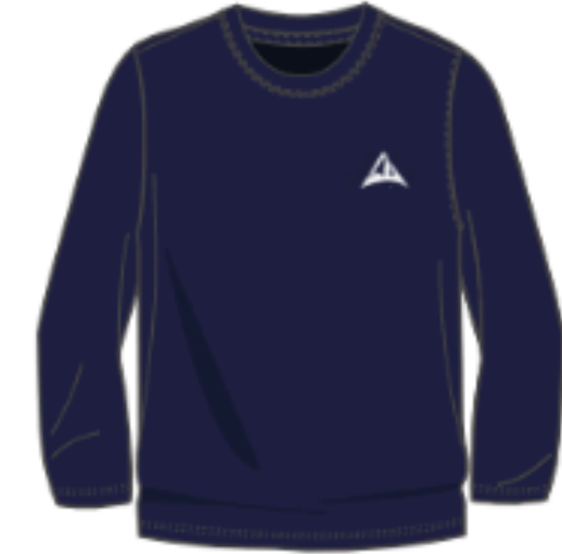
MJ4000 Molleton (5e année seulement)