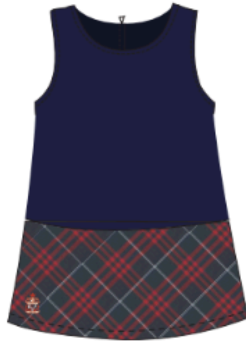
*ME6050 (Maternelle & 1ère année)