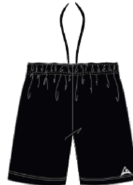
MJ707BL SHORT SPORT(GARÇON)