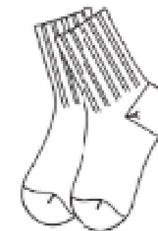
MJ80 BAS COURT