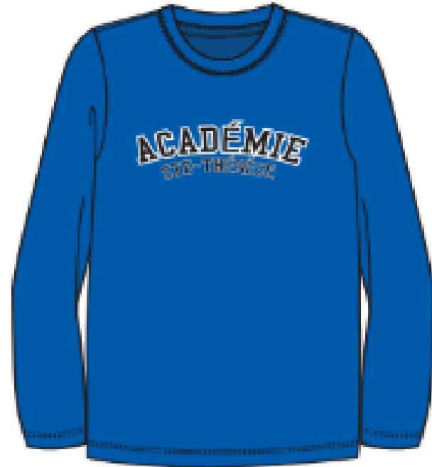
MJ146RO DRY FIT