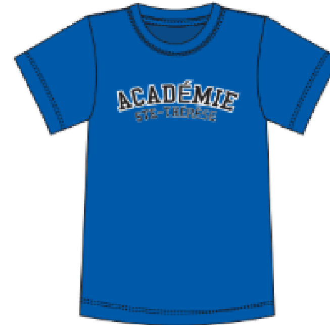
MJ145RO DRY FIT