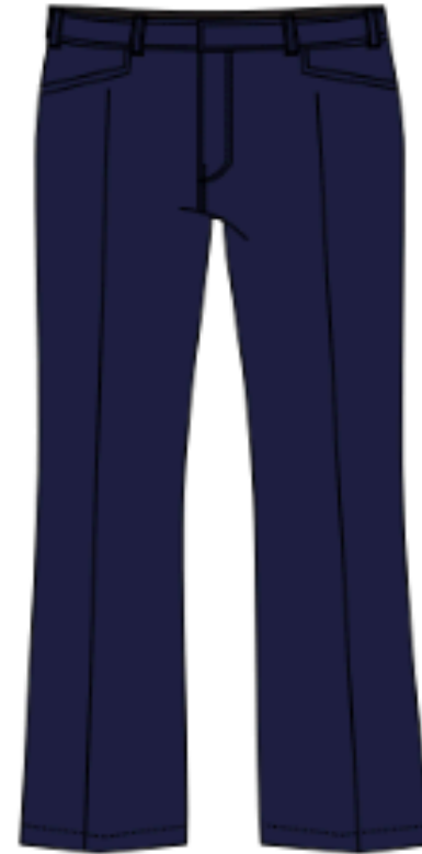
*MOD30203 (Taille basse)