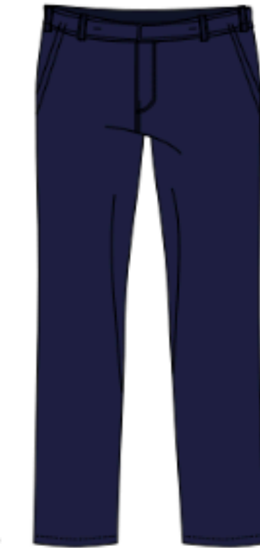
OU *MOD31603 (Chino)