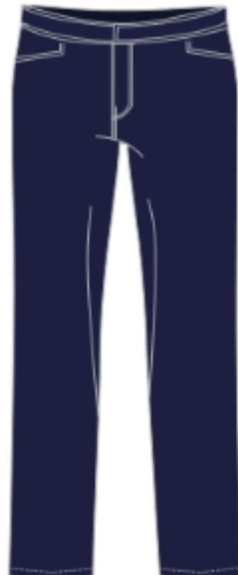
*MOD33603 (Tissus extensibles)