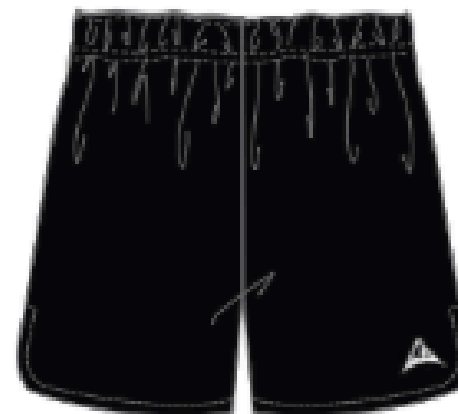
MJ708BL SHORT SPORT(FILLE)