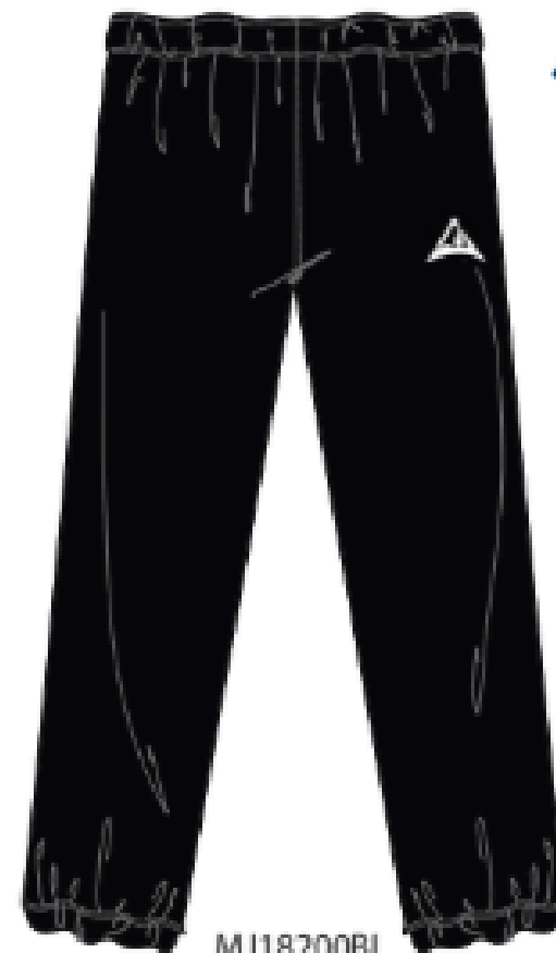
MJ18200BL PANTALON OUATÉ