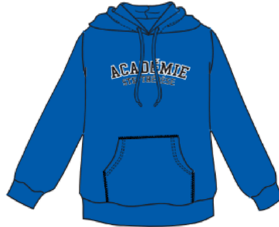
MJ148 "AIR FLEECE"