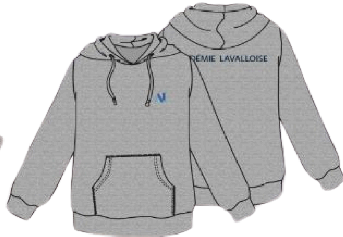
AL18500B Jusqu'à épuisement ★