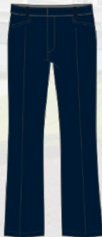
MOD33603 Tissus Lycra semi-extensible