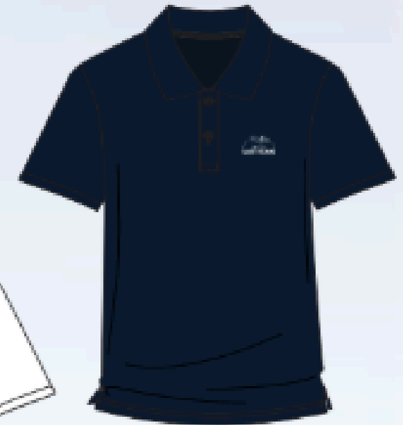
SH610 (dry fit)