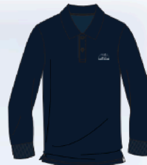
SH91 POLO DRY-FIT (unisex)