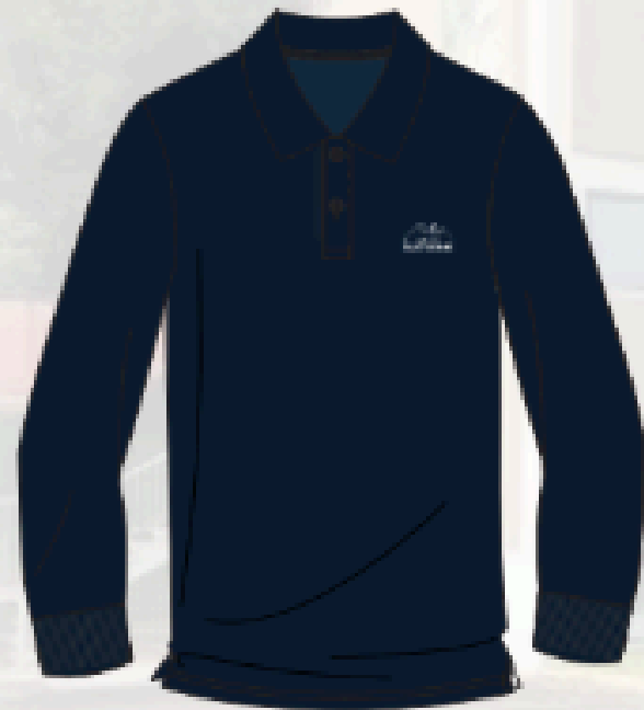
SH91 POLO DRY-FIT (unisex)