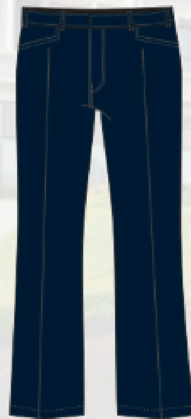
MOD31603 PANTALON TAILLE BASS Tissus Lycra semi-extensible