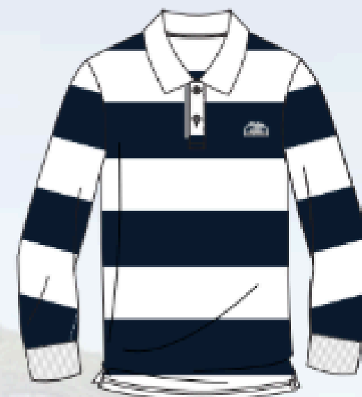
SH611 (unisex) *sec. 4 & 5 seulement