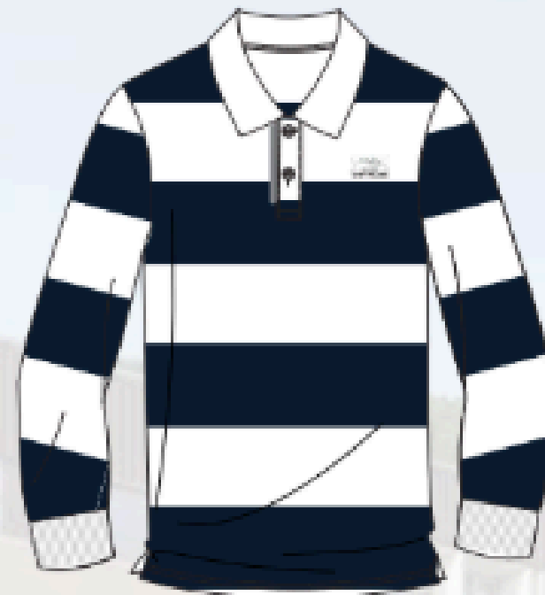
SH611 (unisex) - *sec. 4 & 5 seulement