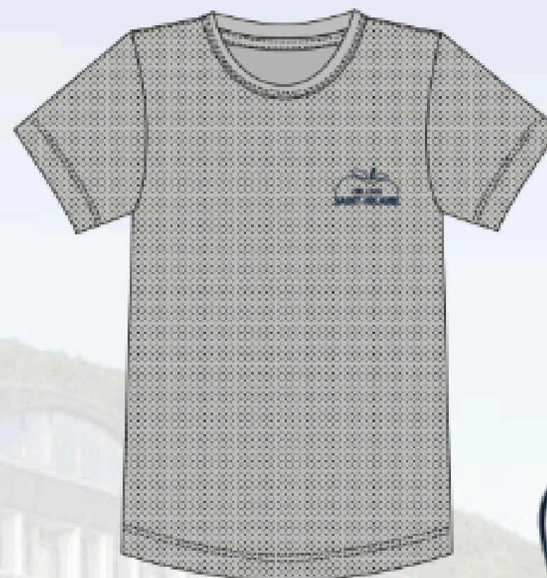
SH1103 (dry fit)