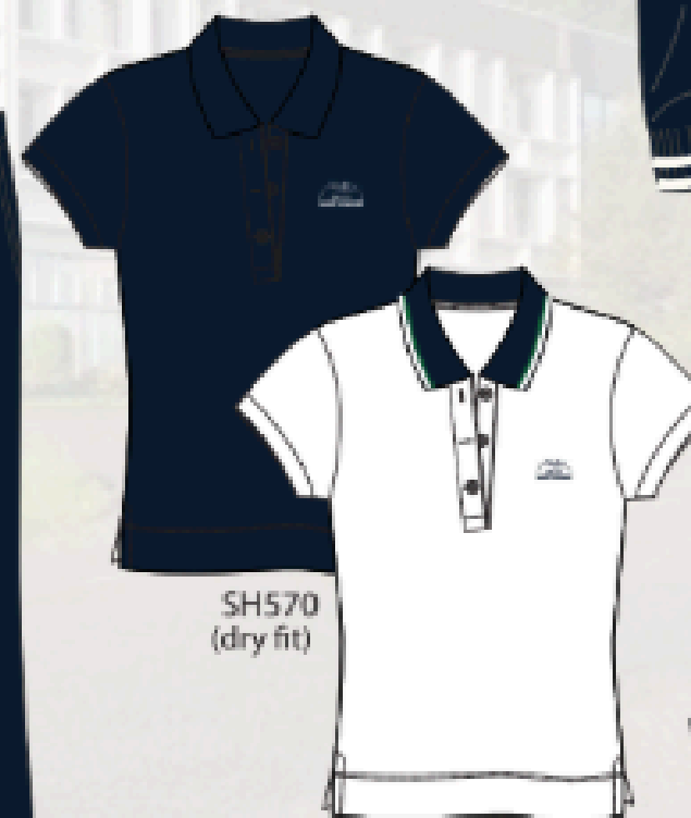
SH570 (dry fit)